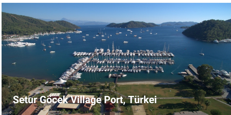
Setur Göcek Village Port, Türkei