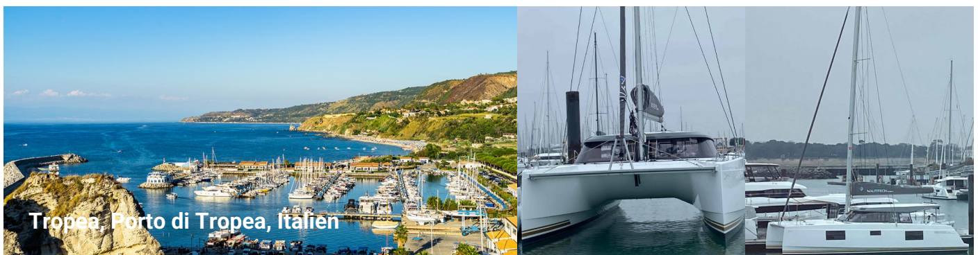
Tropea, Porto di Tropea, Italien