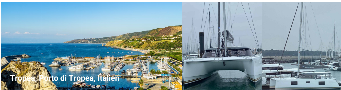
Tropea, Porto di Tropea, Italien