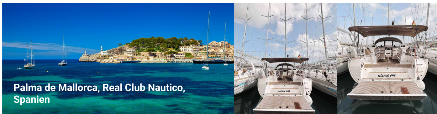
Palma de Mallorca, Real Club Nautico, Spanien