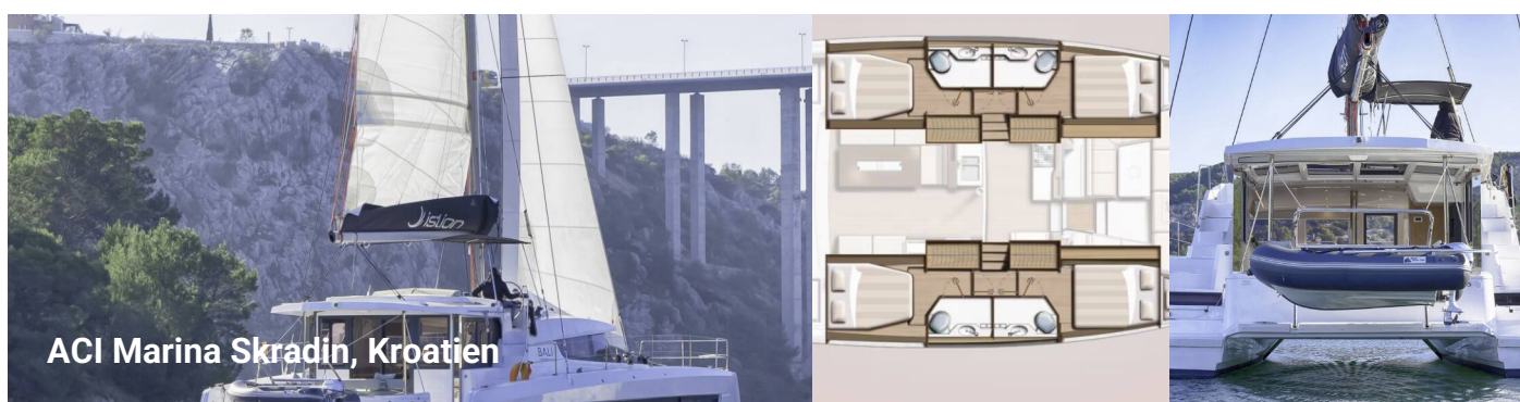
ACI Marina Skradin, Kroatien