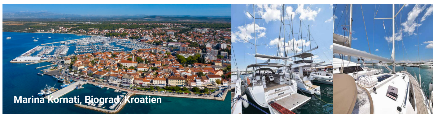
Marina Kornati, Biograd, Kroatien