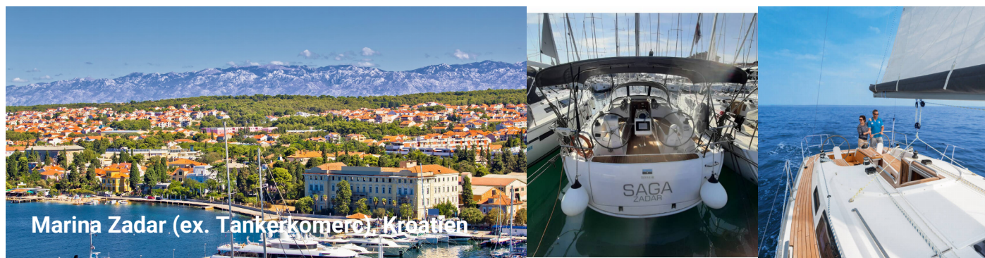
Marina Zadar (ex. Tankerkomerc) Kroatien