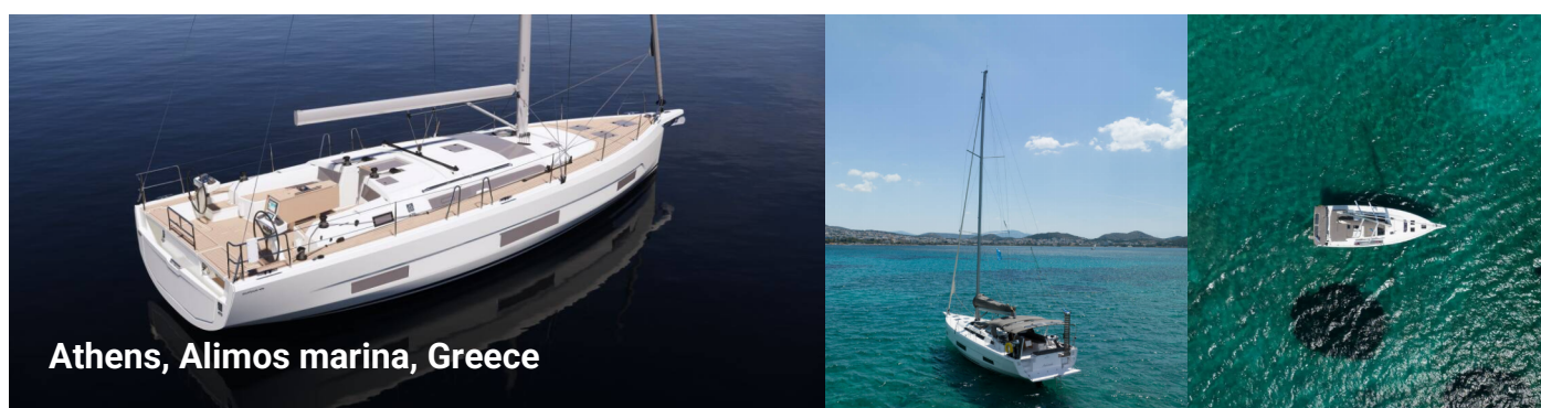
Athens, Alimos marina, Greece