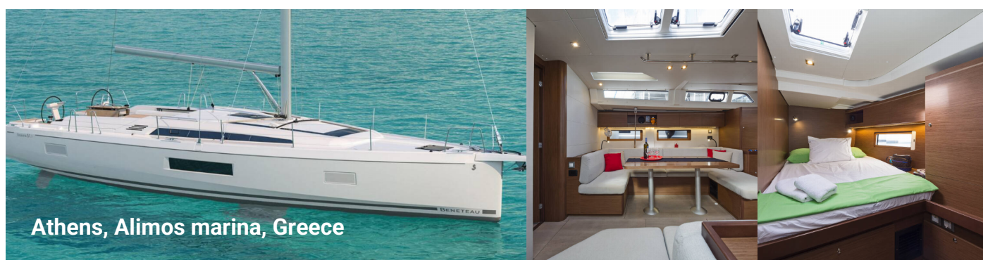
Athens, Alimos marina, Greece