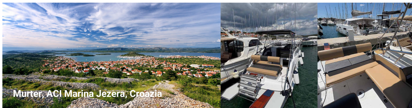
Murter, ACI Marina Jezera, Croazia