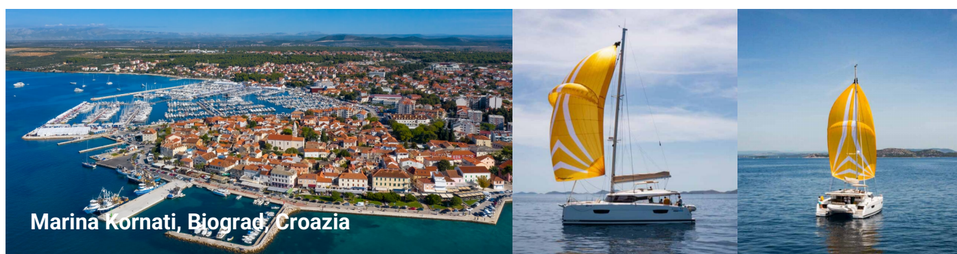
Marina Kornati, Biograd, Croazia