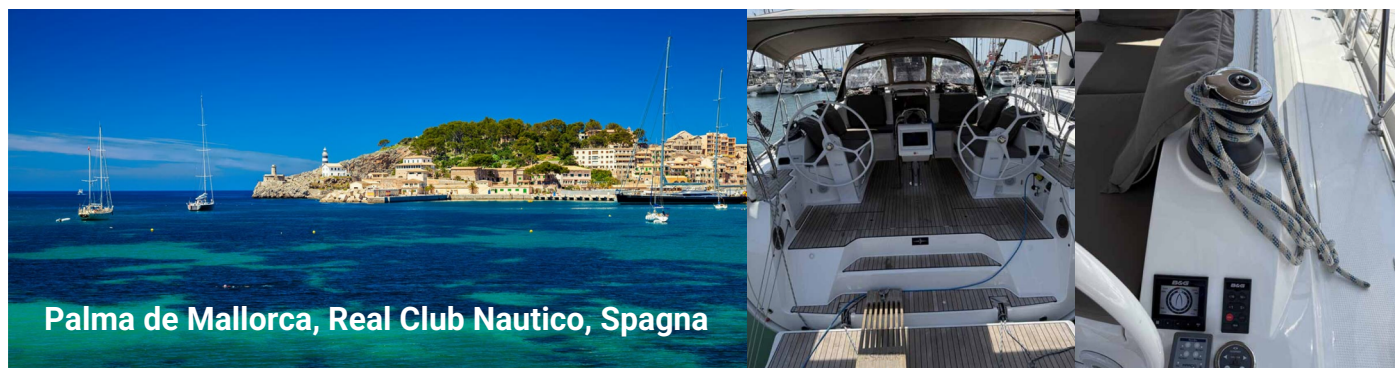
Palma de Mallorca, Real Club Nautico, Spagna