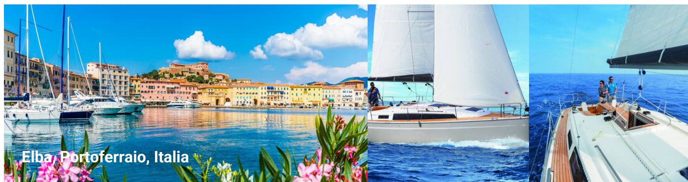
Elba, Portoferraio, Italia