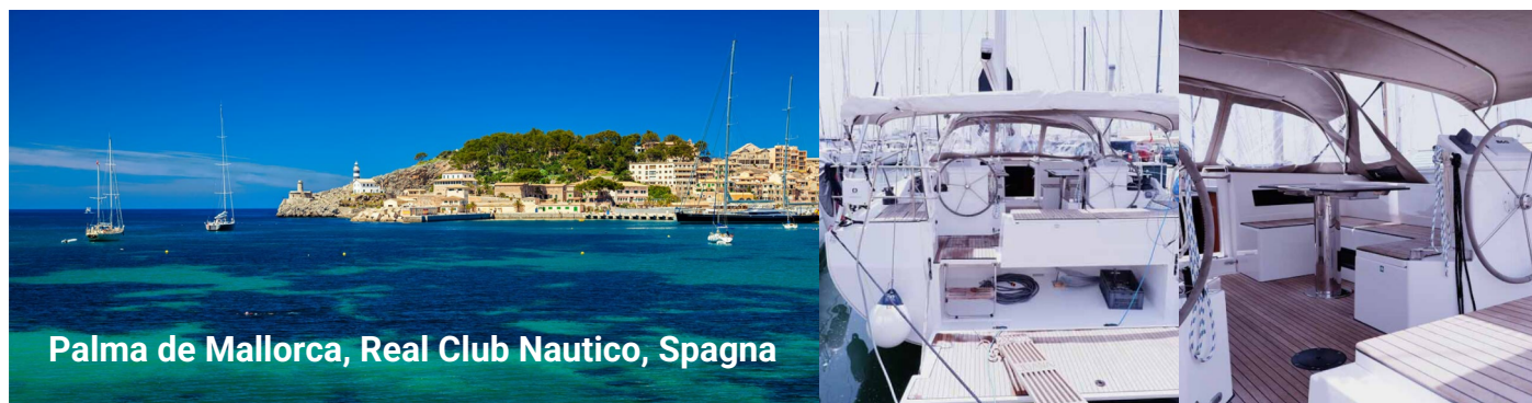
Palma de Mallorca, Real Club Nautico, Spagna