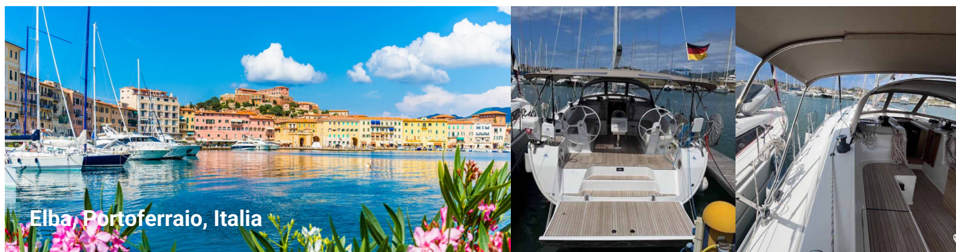
Elba, Portoferraio, Italia