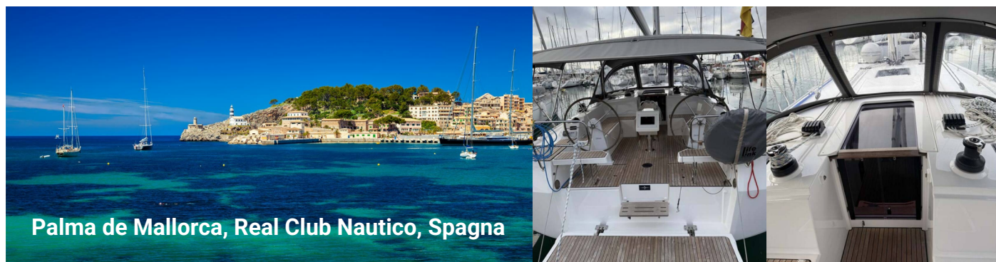
Palma de Mallorca, Real Club Nautico, Spagna