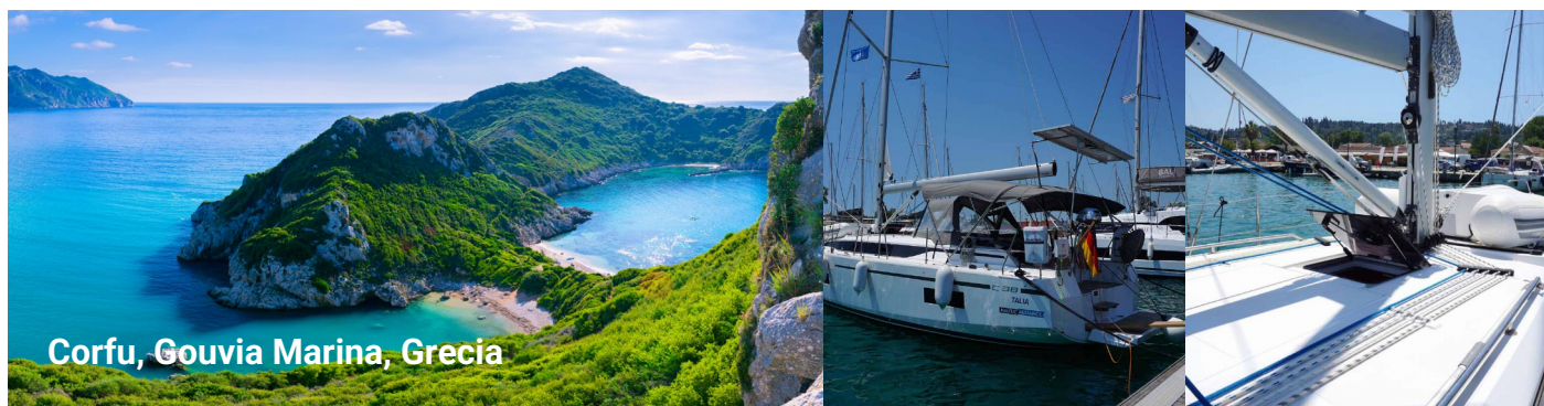
Corfu, Gouvia Marina, Grecia