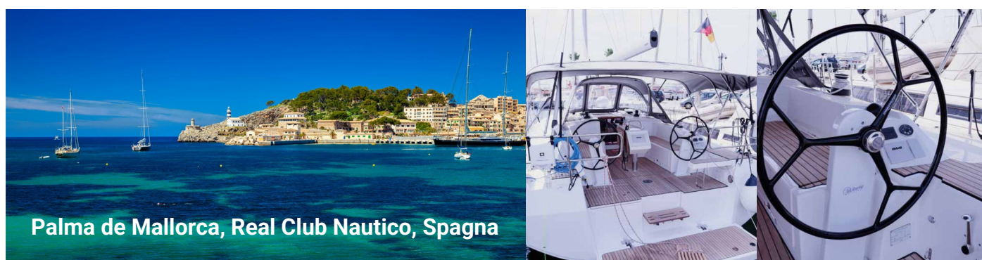
Palma de Mallorca, Real Club Nautico, Spagna