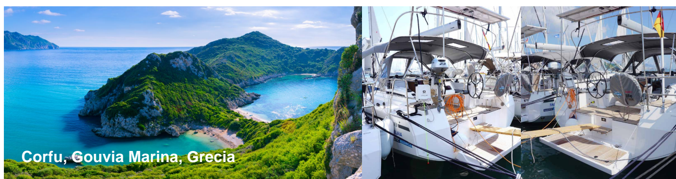
Corfu, Gouvia Marina, Grecia