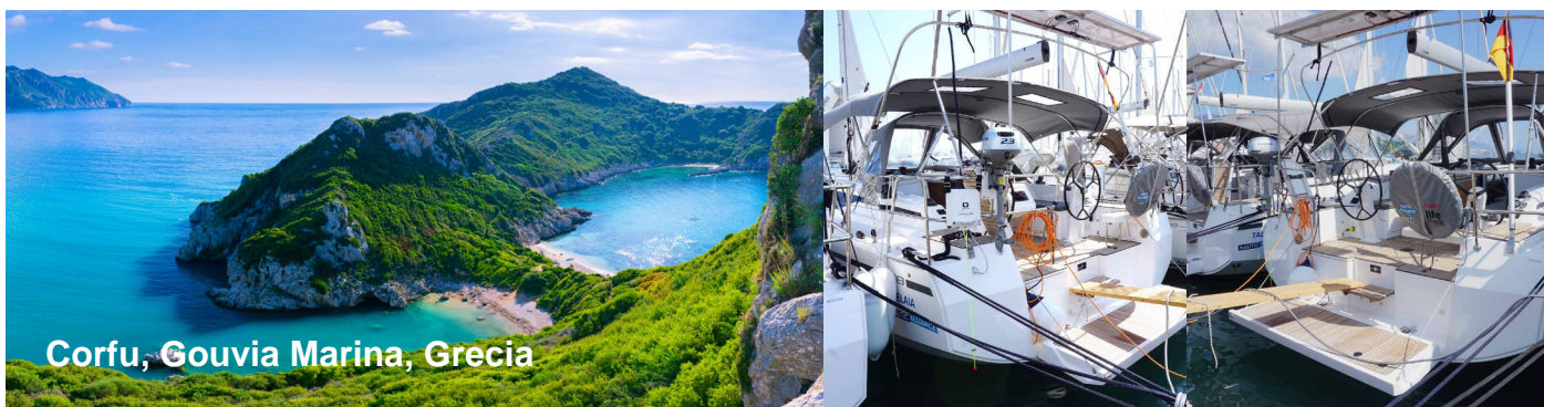
Corfu, Gouvia Marina, Grecia