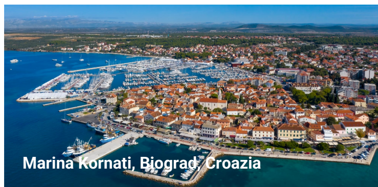
Marina Kornati, Biograd, Croazia