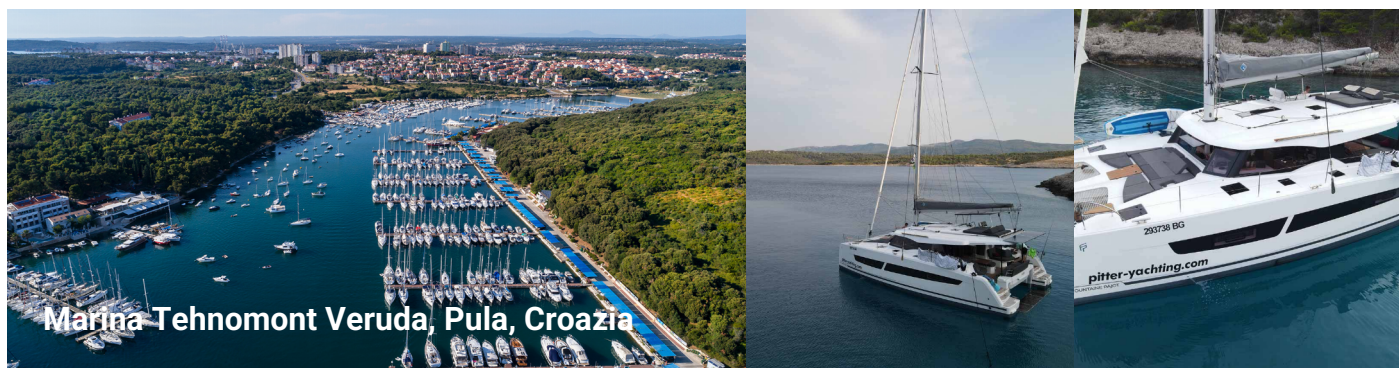
Marina Tehnomont Veruda, Pula, Croazia