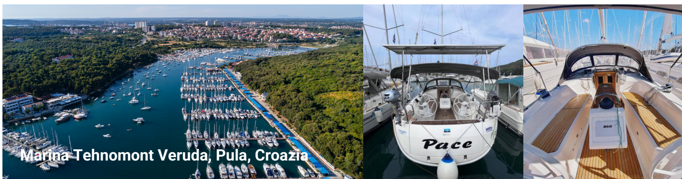
Marina Tehnomont Veruda, Pula, Croazia