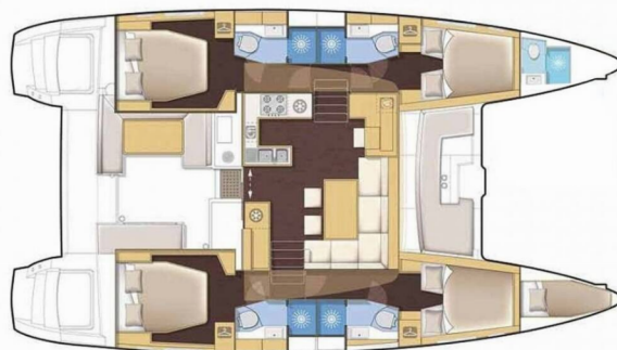
version 4 cabins / 4 cabins version