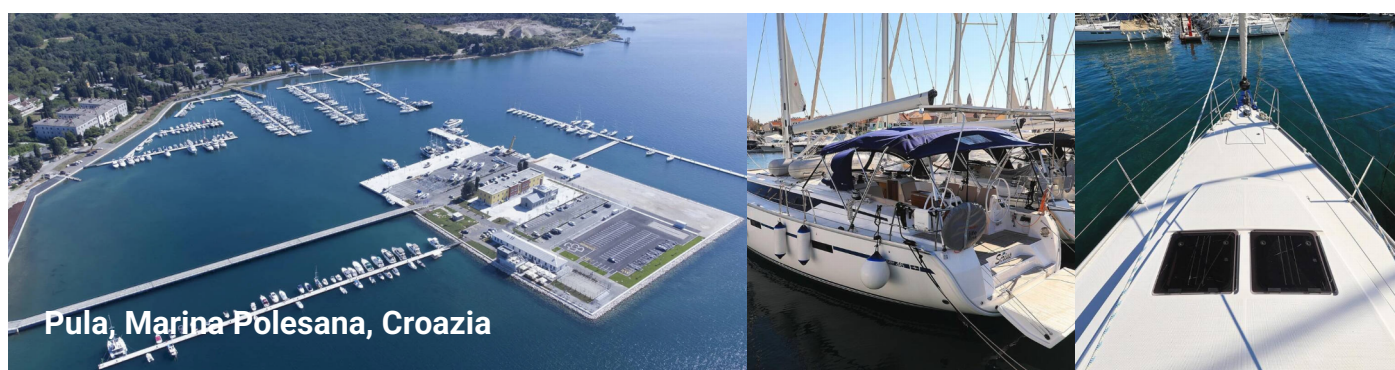
Pula, Marina Polesana, Croazia