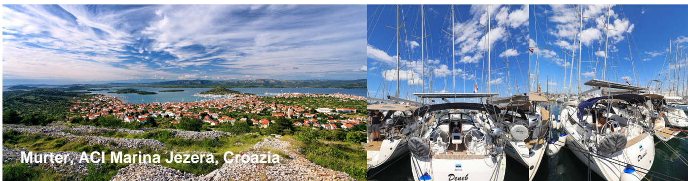
Murter, ACI Marina Jezera, Croazia