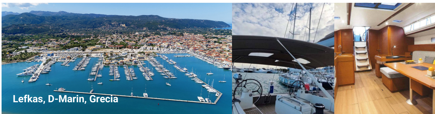
Lefkas, D-Marin, Grecia