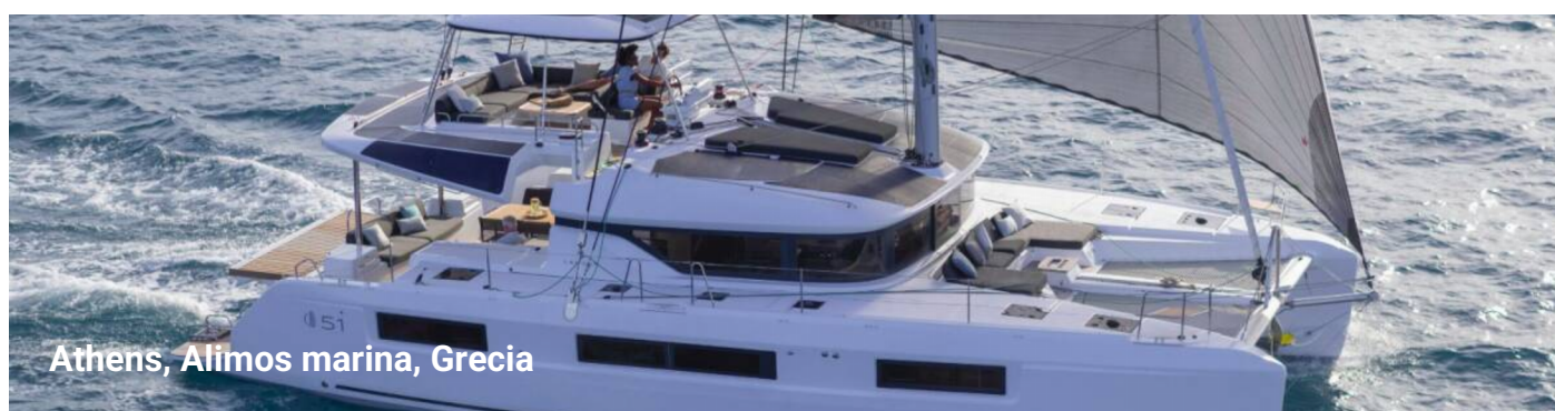
Athens, Alimos marina, Grecia