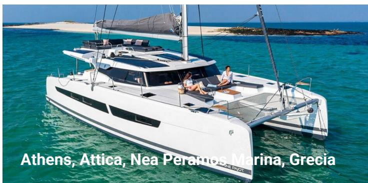
Athens, Attica, Nea Peramos Marina, Grecia