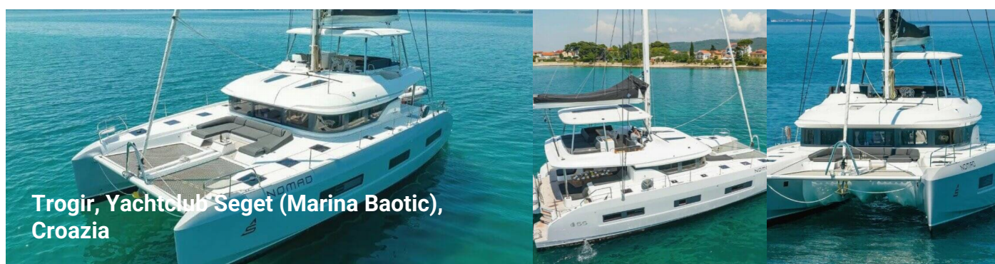
Trogir, Yachtclub Seget (Marina Baotic), Croazia