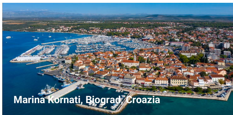
Marina Kornati, Biograd, Croazia