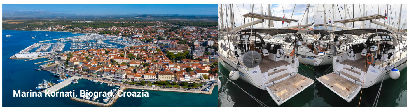
Marina Kornati, Biograd, Croazia