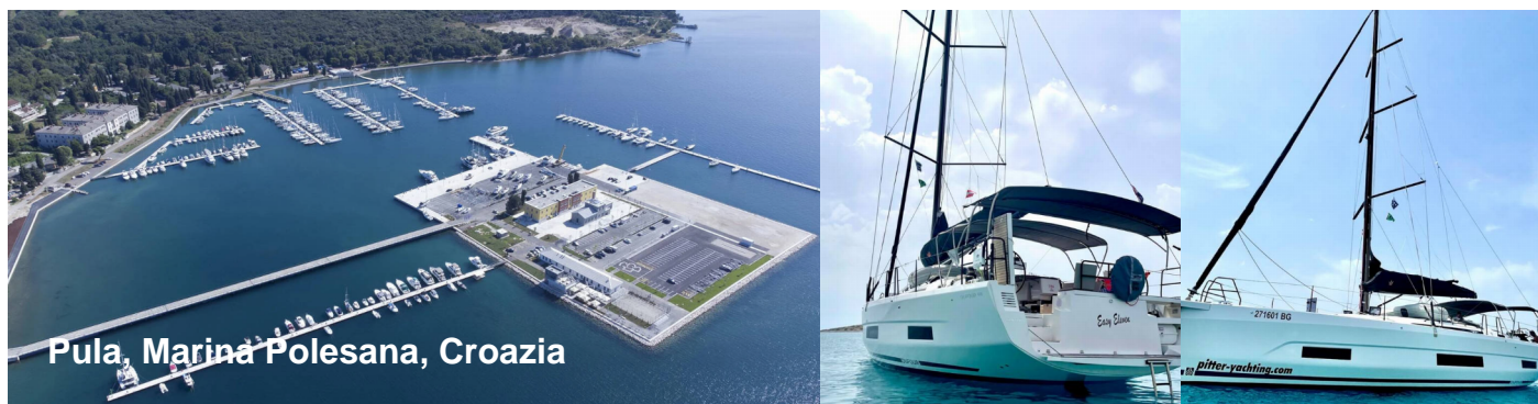
Pula, Marina Polesana, Croazia