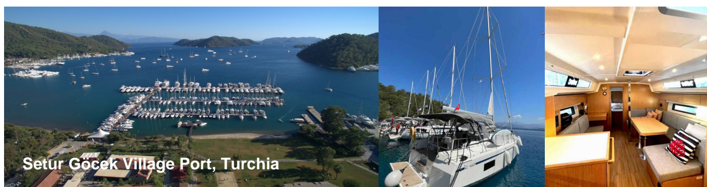
Setur Göcek Village Port, Turchia