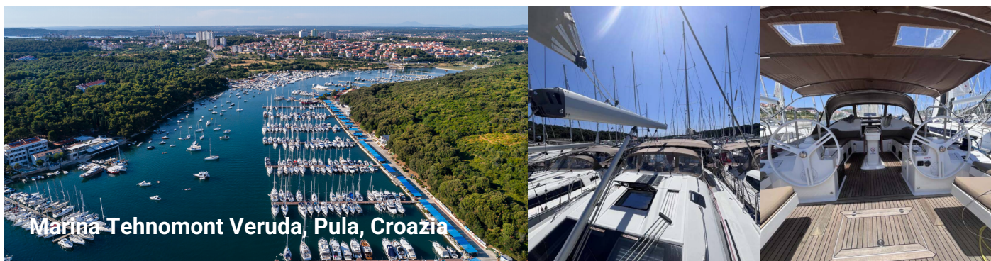
Marina Tehnomont Veruda, Pula, Croazia