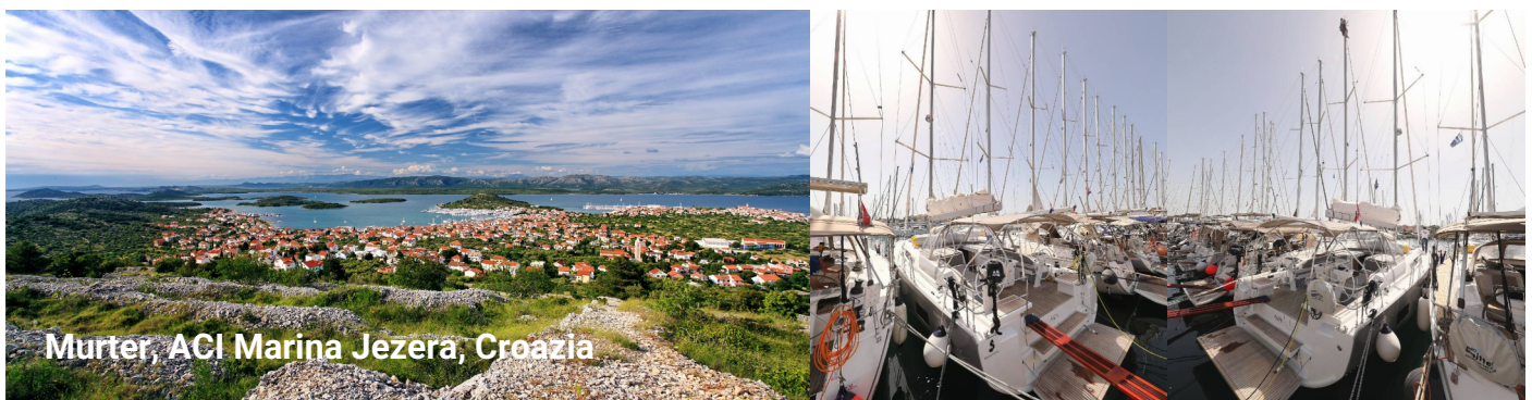
Murter, ACI Marina Jezera, Croazia