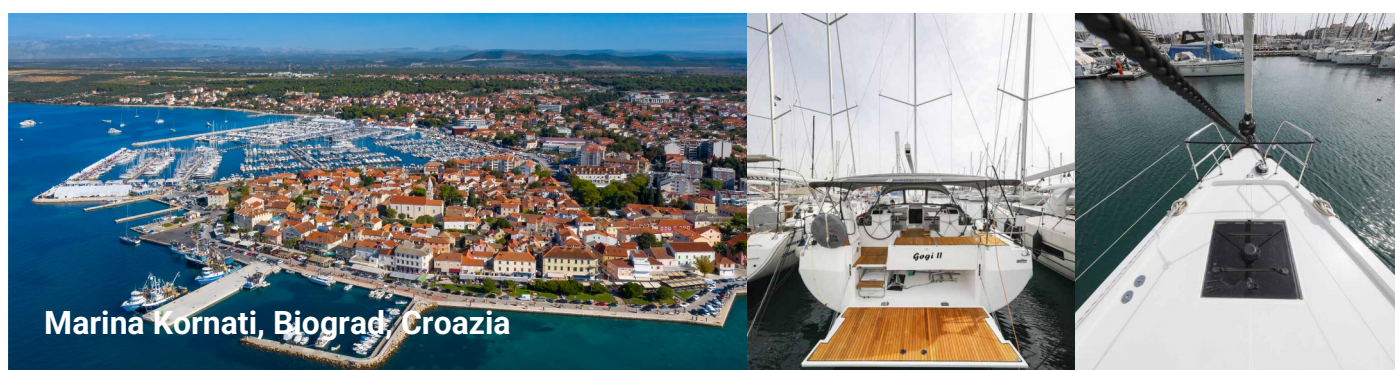
Marina Kornati, Biograd, Croazia