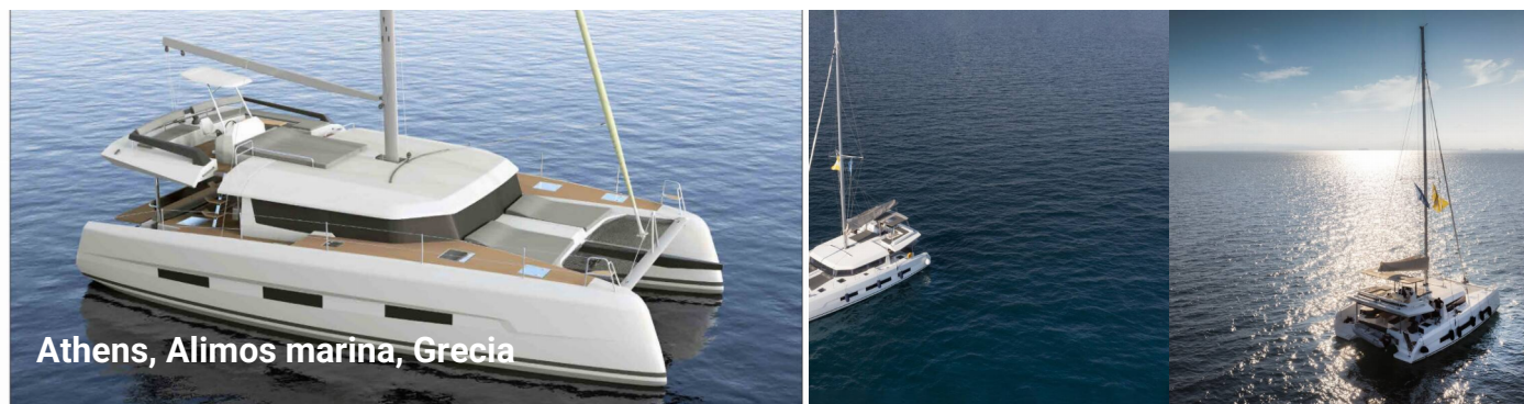
Athens, Alimos marina, Grecia