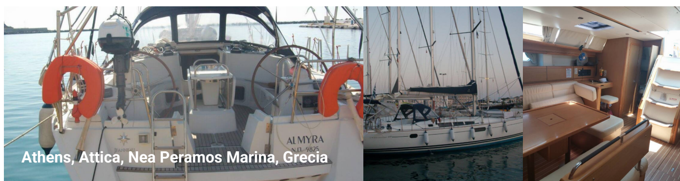
Athens, Attica, Nea Peramos Marina, Grecia