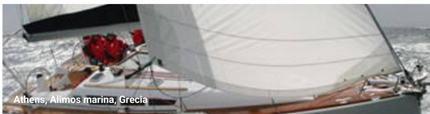
Athens, Alimos marina, Grecia