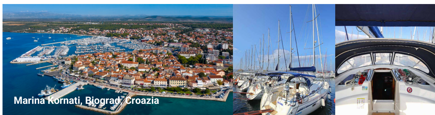
Marina Kornati, Biograd, Croazia