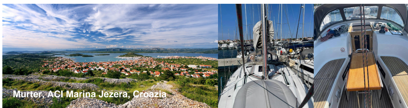
Murter, ACI Marina Jezera, Croazia