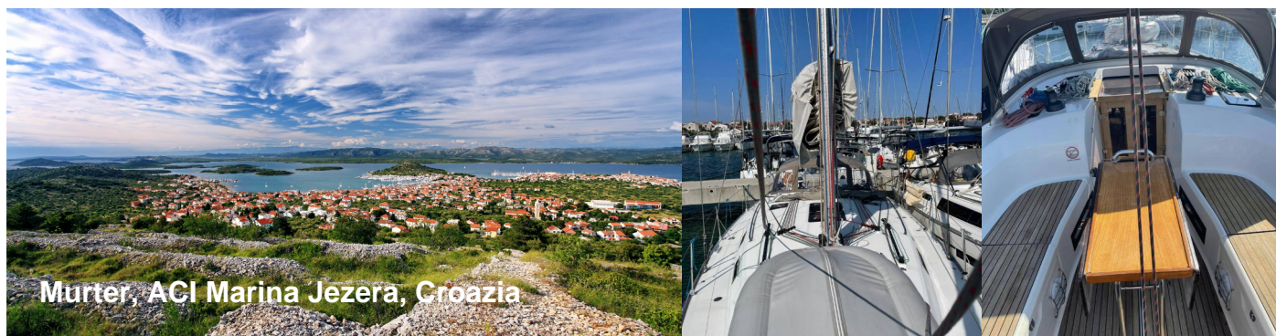
Murter, ACI Marina Jezera, Croazia