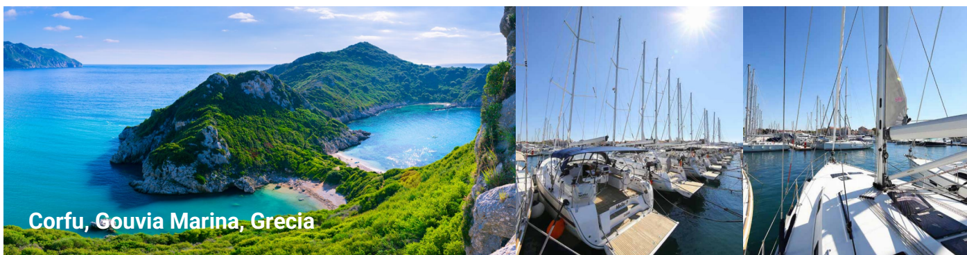
Corfu, Gouvia Marina, Grecia