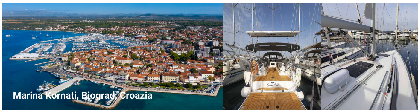
Marina Kornati, Biograd, Croazia