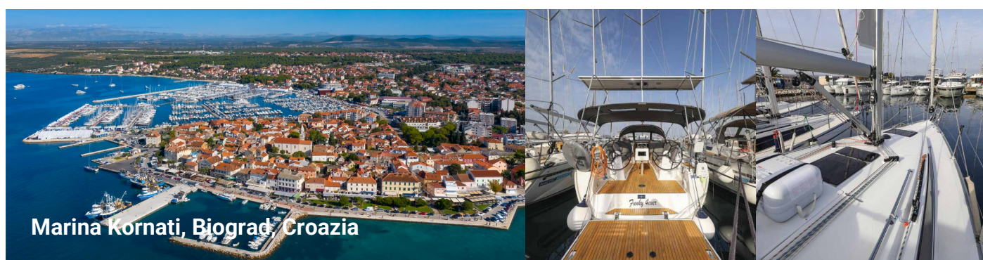
Marina Kornati, Biograd, Croazia