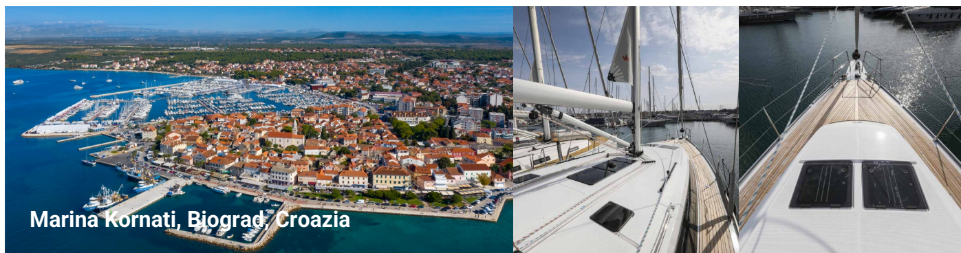
Marina Kornati, Biograd, Croazia