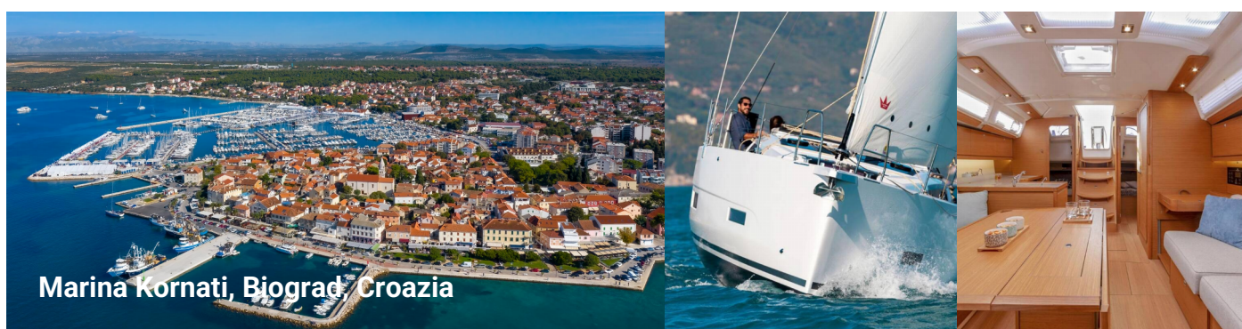
Marina Kornati, Biograd, Croazia