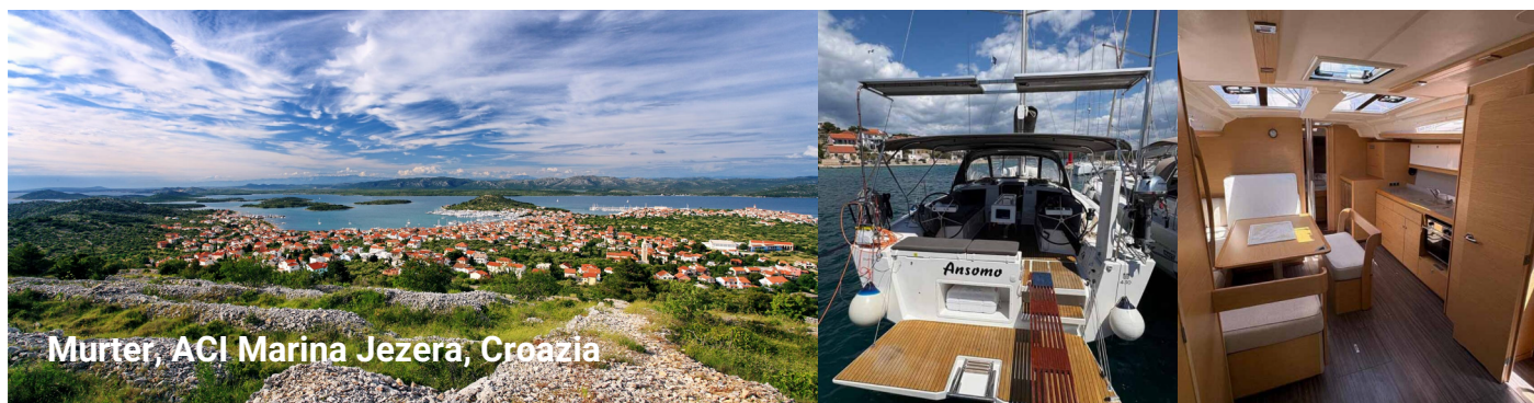
Murter, ACI Marina Jezera, Croazia