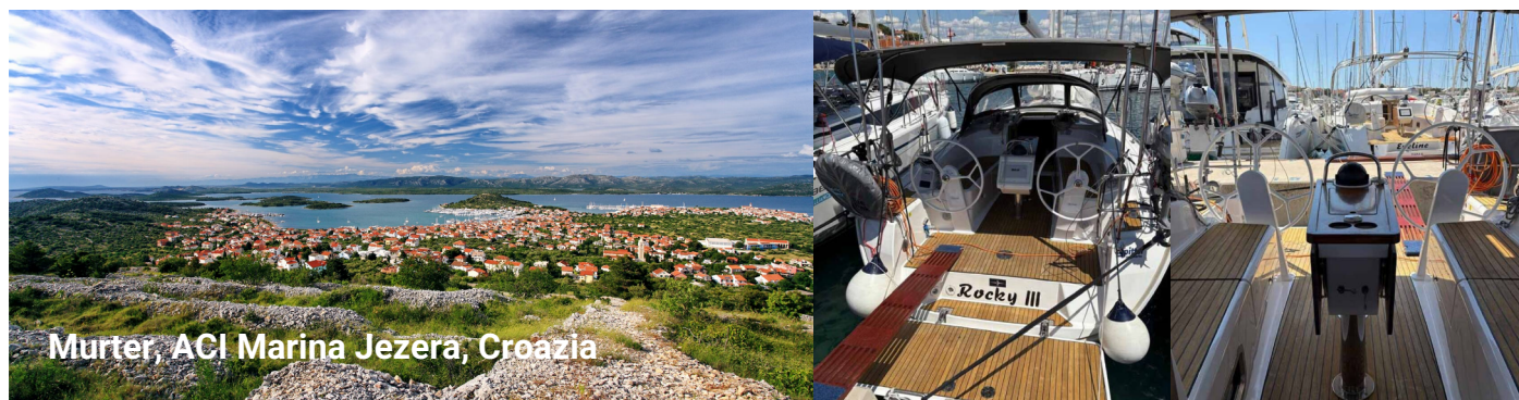
Murter, ACI Marina Jezera, Croazia