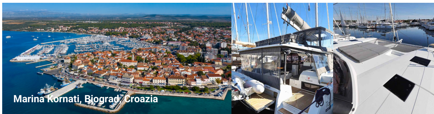
Marina Kornati, Biograd, Croazia