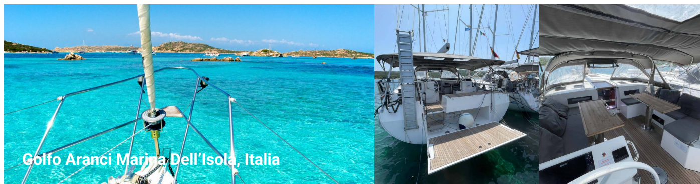
Golfo Aranci Marina Dell'Isola, Italia