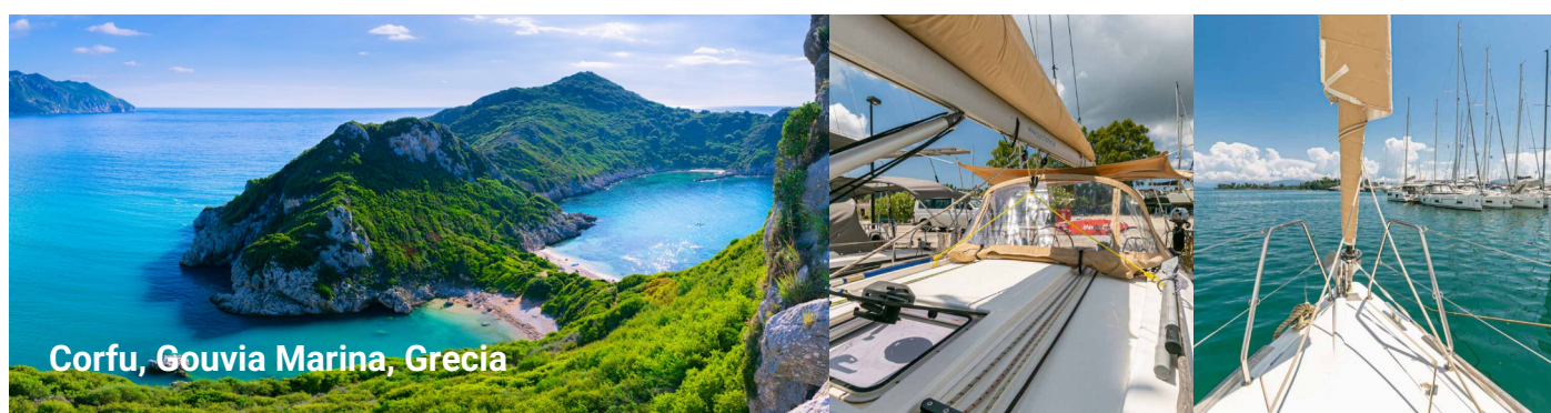
Corfu, Gouvia Marina, Grecia