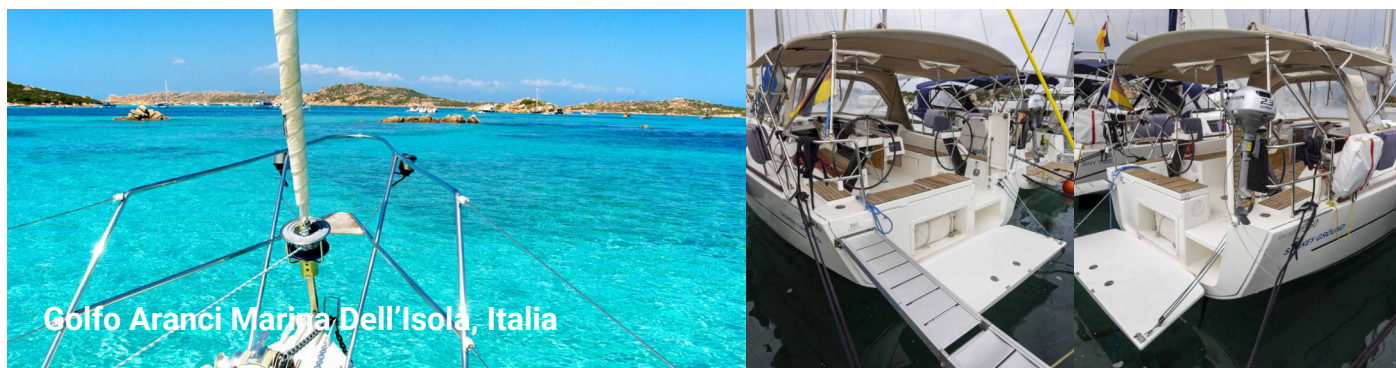
Golfo Aranci Marina Dell'Isola, Italia